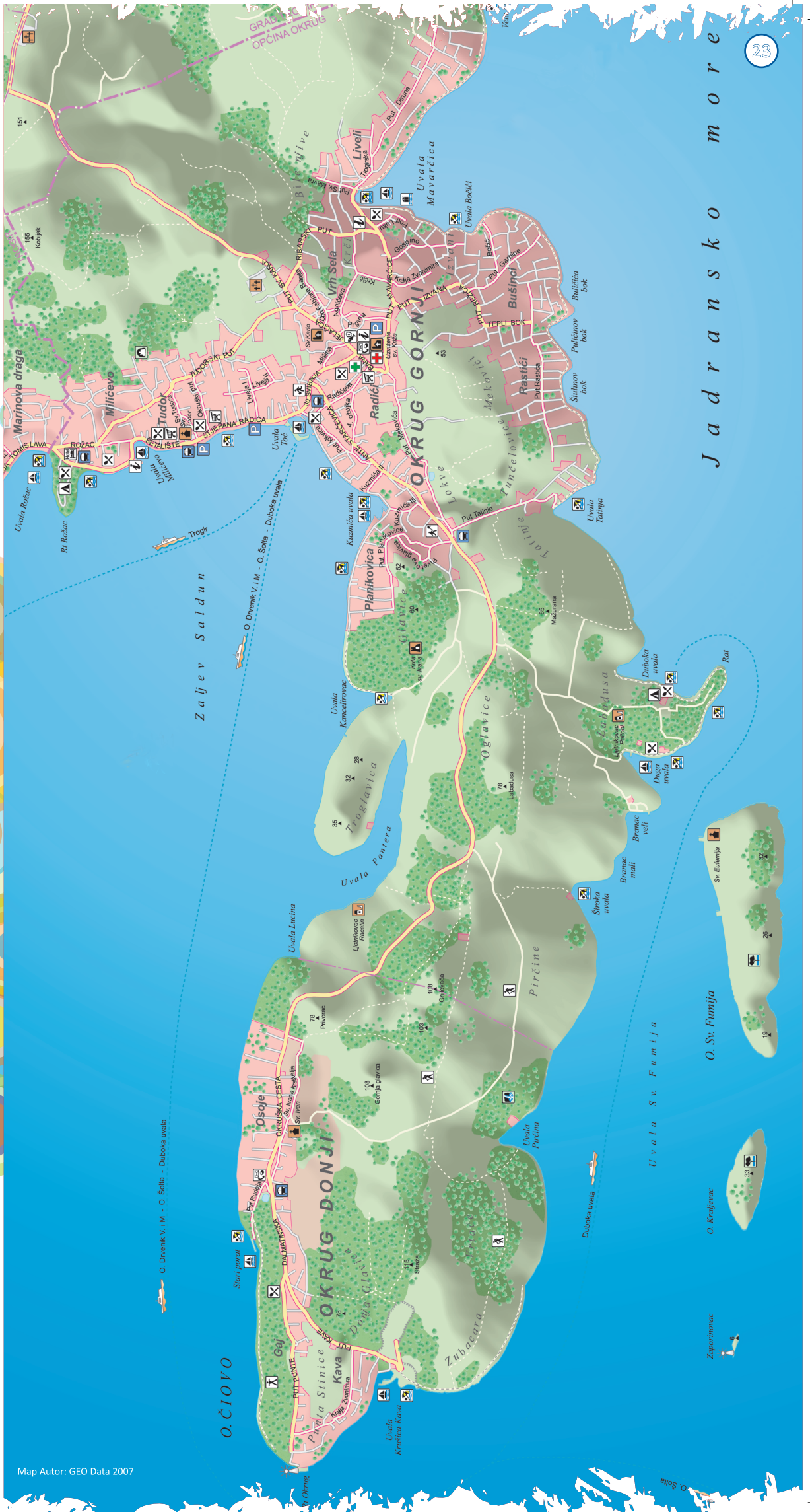
Map Autor: GEO Data 2007