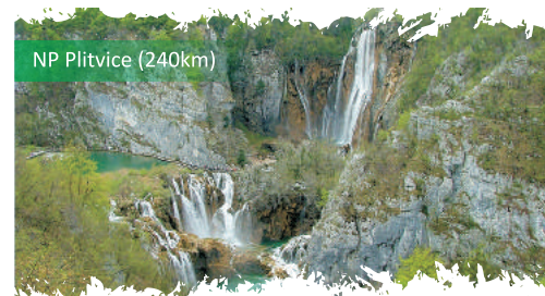
NP Plitvice (240km)

Это идеальное географическое положение обеспечивает отличное подключение чтобы осматривали достопримечательности других туристических и культурных мест.