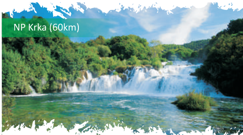
NP Krka (60km)